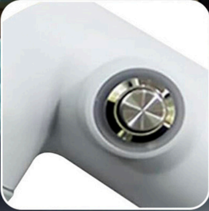
Clean water outlet control button