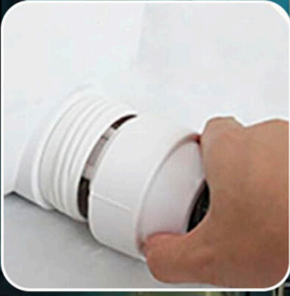
Quick release connector