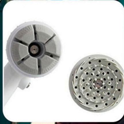
Sponge shower head for bathing, silicone shower head for hair washing