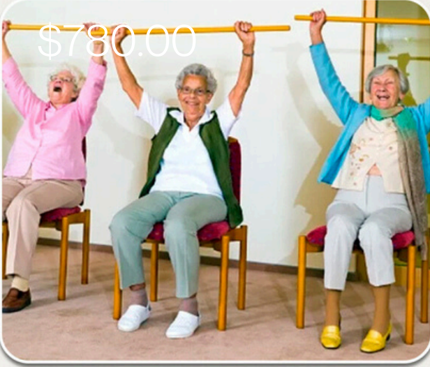
Community service centre